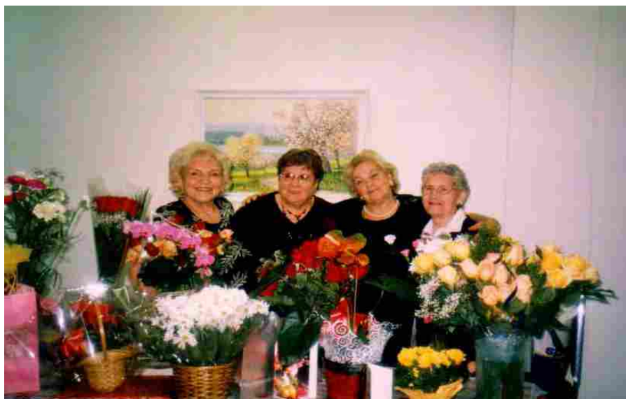
С мои приятелки след юбилея

През 1995 година станах член на Канадско-славянската асоциация в Монреал и получих жилище в един от двата жилищни блока, собственост на Асоциацията. Бързо се приобших в новата среда и още на първото отчетно годишно събрание ме избраха за член на Административния съвет, през следващата 1997 година станах касиер, а от 1998 година и до днес съм президент на Асоциацията. Преизбираха ме многократно на този пост, защото обичам да помагам на хората и на никого не съм отказала подкрепа.