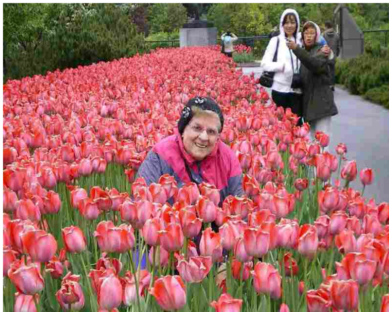
На екскурзия в Отава за празника на лалетата

За Хилядата острова бях приготвила за всеки пликче с храна и безалкохолно, а при разходките до връх Монтраблант