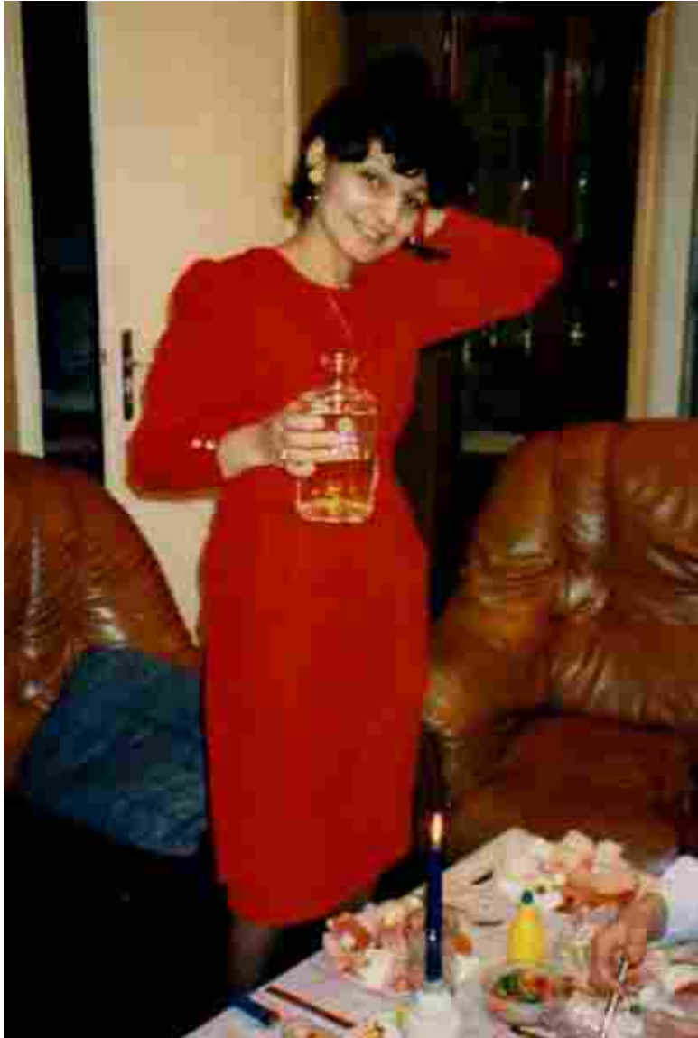
Весела във апартамент под наем в Руан